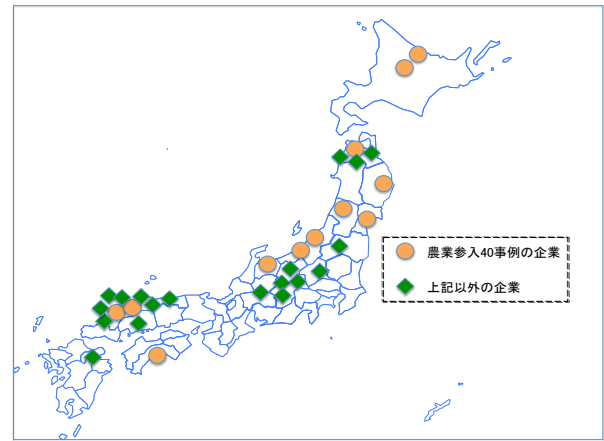
図-1 建設業の農業参入アンケート調査 31社

回答企業31社は、地方の中小建設業であり、資本金は100万円から9,800万円で平均は3,654万円、従業員数は4人から200人で平均は45.7人、売上は800万円から60億円